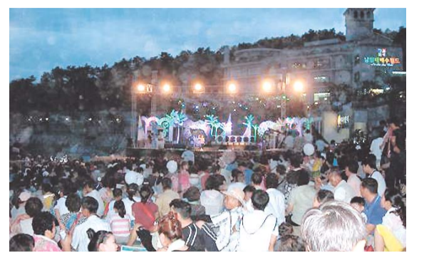
지난해 남일대해수욕장에서 개최된 해변가요제 전경

시는 주 5일 근무, 휴가철로 인해 여름 피서철에는 아름다운 남쪽바다를 찾는 관광객이 급증할 것으로 예상하고 편의시설 정비와 함께 상가번영회와 공동으로 바가지요금 안락기 결의대회를 개최하고 협정요금을 정하는 등