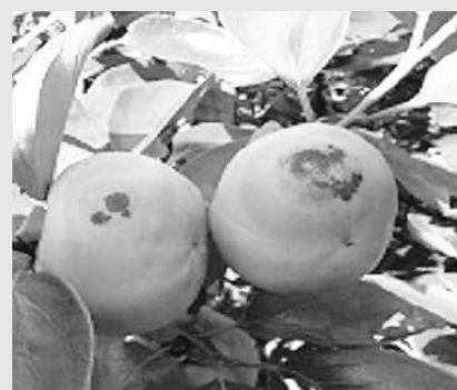
단감 일소 피해과

방지대책으로는 과실들이 강한 직 사광을 받지 않게 가지를 배치하고 과다 작과를 시키지 않고 수관내부 에 햇빛이 골고루 들어갈 수 있게 도장지 정리(하계정전) 및 일소를 받은 과실은 추가적인 피해 감소를 위해서 가능한 늦게 제거하여야 한 다.