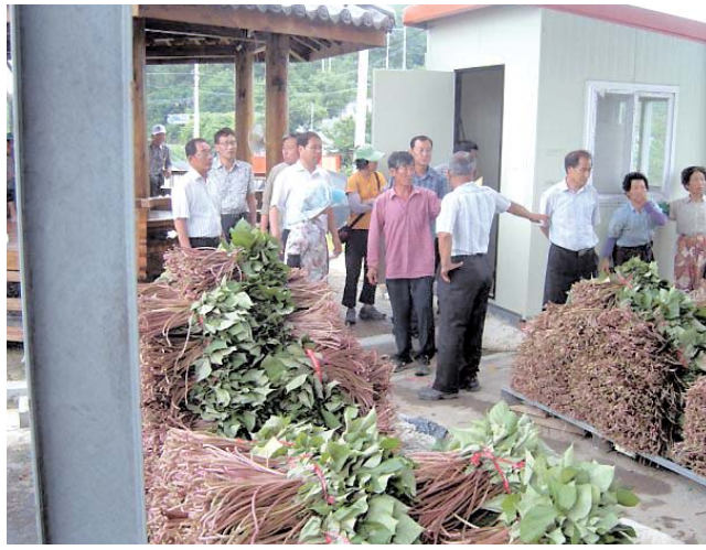
산지유통 활성화를 위한 서포농협 마을경매장 운영 모습

사천시농업기술센터에서는 미백 위주의 농업 경영을 권역별 유망채소 육성과 논소득 기반 다 양화사업 확대 추진으로 기후변화에 따라 우리지 역에 적응성이 높은 품종 보급과 계절별 출하 다 양화 및 고령 농업인들이 소득에 참여할 수 있는 농업을 중점 육성할 계획이며, 서포지역에서 운 영되고 있는 산지 경매장을 관내 권역별 운영 확 대를 위해 재배기술 및 마케팅 지원을 확대할 방 침이다.