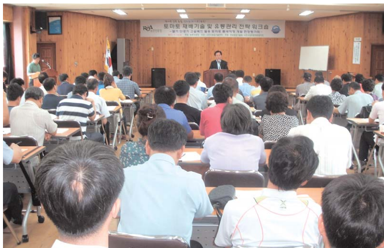
사천시 농업기술센터는 지난 7월 13일 전국 토마토 강소농 농업인 등 150여 명이 참석한 가운데 『딸기 고설베드 이용 토마토 저단 밀식재배』 워크숍을 개최했다.

토마토 유효작심 2줄기 재배기술은 토마토 본잎 2~3매 시기에 딱딱한 남기고 적당한 후 딱딱한 사이에 발생한 2개의 신초를 15~25일 육묘해 정식하여 재배하는 기술로 유효작심 후 2줄