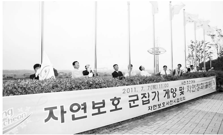
한편, 자연보호 사천시협의회는 내년에도 시민이 잘 볼 수 있도록 용두공원에 자연보호 군집기를 추가 설치할 계획이다.

건이지만 회원의 뜻을 한데 모아 자연보호 실천운동에 모두 앞장서 줄 것"을 당부했다. 또한, 사천시장은 "자연보호기(旗)는 모든 사람이 자연환경의 중요성을 인식하고 자연과 인간이 더불어 살아가자는 뜻을 담고 있다며, 깨끗한 자연은 우리 미래의 희망으로 자연을 사랑하는 마음을 새롭게 다짐하는 계기가 되어 친환경도시 행복도시 사천을 꾸어 나가자."라고 말했다.