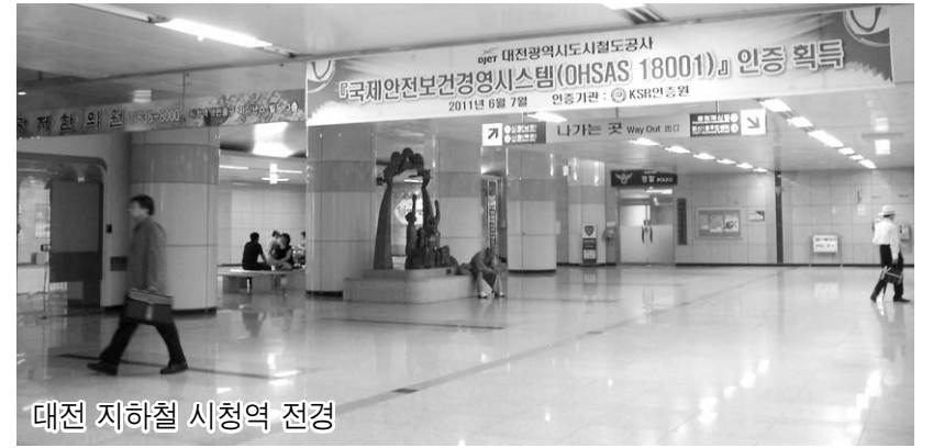
대전 지하철 시청역 전경

애향운동[사천삼천포에 가보자] 운동본부(회장 천봉근)는 대전지하철 시청역에서 [사천삼천포에 가보자]대전시청역 사진전시회를 개최할 계획으로 준비 중이다.