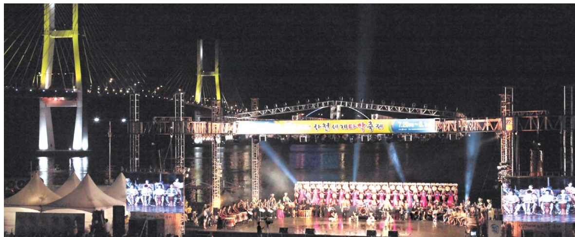
2011 사천세계타악축제 행사종목 및 일정

한편 시는 우리 사천지역의 역사를 중국대륙에 대외적으로 널리 알리는 계기 마련을 위해 조명군총과 아울러 사천시의 중국과의 역사성이 깊음을 소개시켜 관광 상품개발과 관광객 유치에 최선을 다했다.