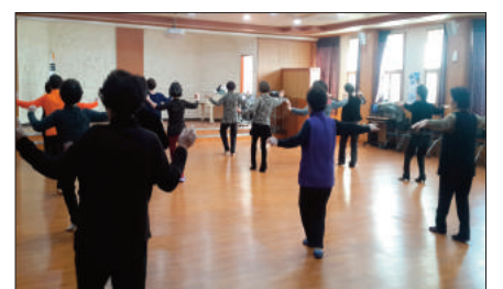
에 대표적으로 초급반을 신설 추진하게 되었다"며 앞으로 적극적인 지원과 협조를 아끼지 않겠다고 말했다.

프로그램 신설을 위해 지난 2월 초부터 홍보 및 수강 희망자를 모집하였으며, 25명의 회원과 함께 매주 화·목요일 15~17시에 진행된다. 광범한 선구동주민자치위원장은 "스포츠댄스의 인기가 높아 그간 꾸준히 초급반 신설에 대한 요청이 있어 왔으며, 선구동·서·동서금동 3개동의 주민자치위원장이 논의한 결과 3개동 연합으로 선구동