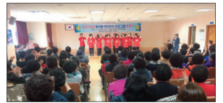
팀의 노래 발표는 상인, 지역주민 및 수강생 간 화합의 장을 만든 뜻깊은 자리였다.