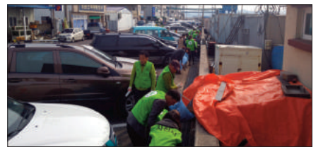
위해 불법 투기로 방치된 쓰레기를 수거하고, 불법 광고물을 철거하는 등 구슬땀을 흘렸다.

이날 행사에는 50여명의 조직단체원들이 참여 하였으며 특히 4.21. ~ 4.23까지 삼천포항 등대 일원에서 개최되는 사천시 삼천포항 수산물축제에 대비하여 축제장을 찾는 시민들 및 관광객들에게 깨끗한 환경을 제공하고 관광사천의 이미지를 제고하기