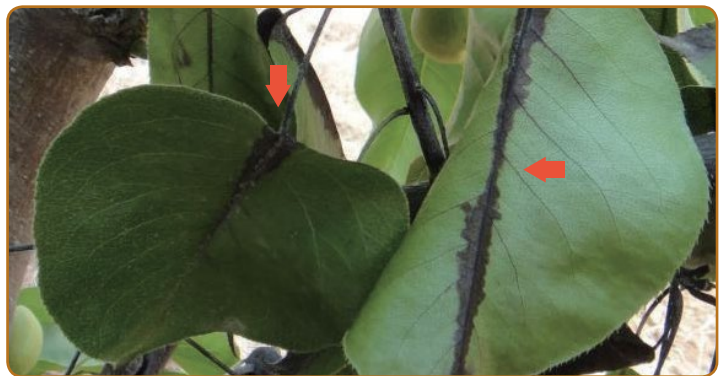
▲ 잎이 주맥을 따라 검게 변함