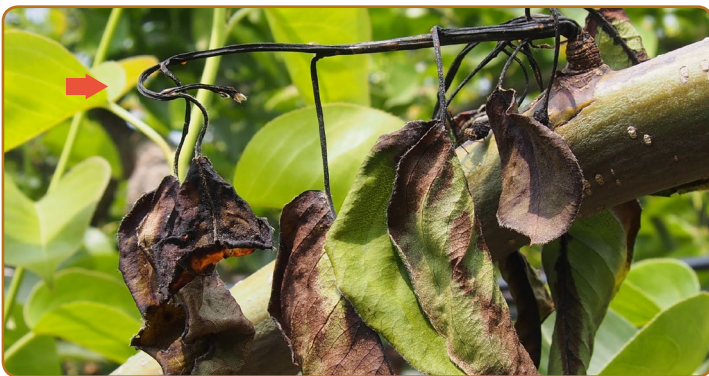
▲ 어린 가지가 검은색으로 마르고, 끝이 시들면서 갈고리 모양으로 됨