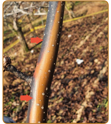
▲ 배 줄기마름병 증상