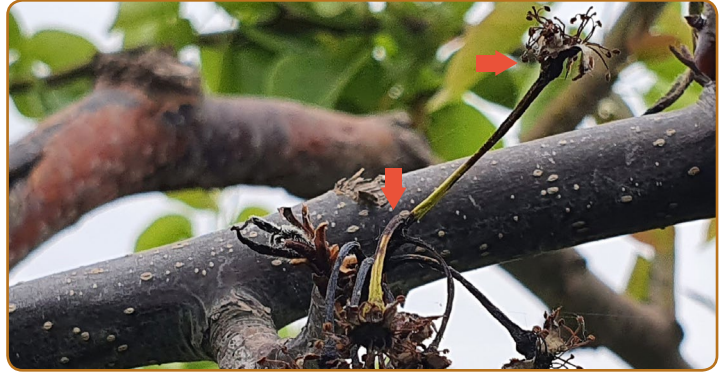
▲ 꽃대가 검게 마름