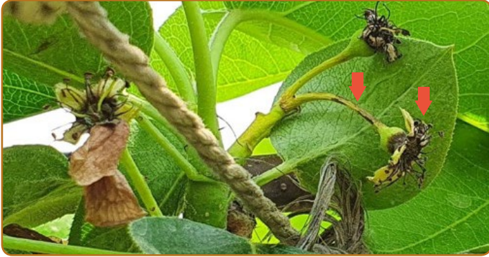
▲ 꽃 감염 초기 증상