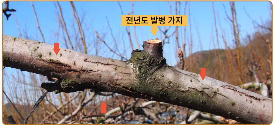
▲ 화상병 궤양 증상