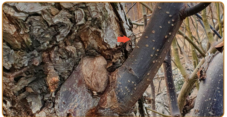
▲ 가지가 갈색 또는 검은색으로 변색