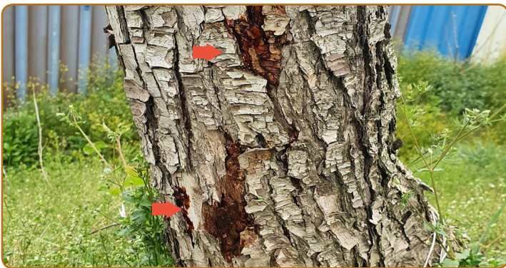
▲ 물오름기 주간부 수피 터짐